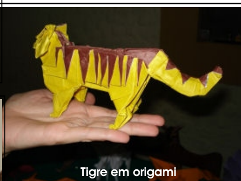
Tigre em origami