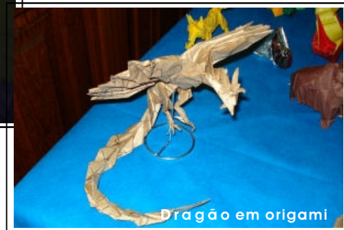
Dragão em origami